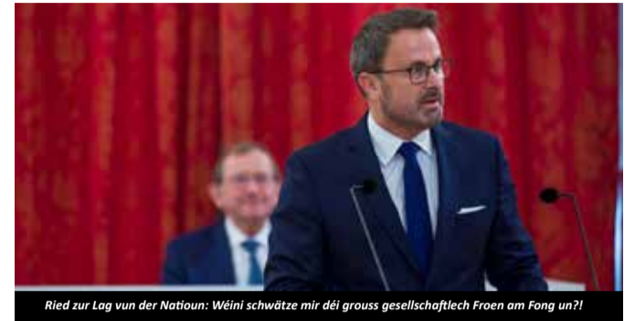
Ried zur Lag vun der Natioun: Wéini schwätze mir déi grouss gesellschaftlech Froen am Fong un?!

ter nun angibt, ein Ja zu Beginn der Diskussionen bliebe dann auch ein Ja („si la réponse à la question est oui, elle reste oui“) und somit den Eindruck vermittelt, als wären die vorgeschriebenen juristischen Prozeduren – mit dem Einspruchsrecht der Bürger*innen und der Zivilgesellschaft – nur noch eine Formsache, so lässt dies doch aufhorchen. Transparenz und demokratische Prozesse in der Ansiedlungspolitik und fachliche, auf Nachhaltigkeitsmaßstäben fußende Kriterien, sind das Gebot der Stunde.